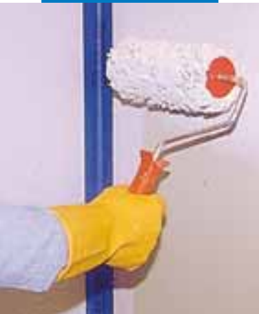
Nanoszenie Mapegum WPS na ścianę przy użyciu wałka