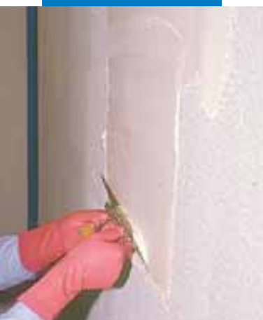
Nanoszenie zaprawy klejowej na Mapegum WPS