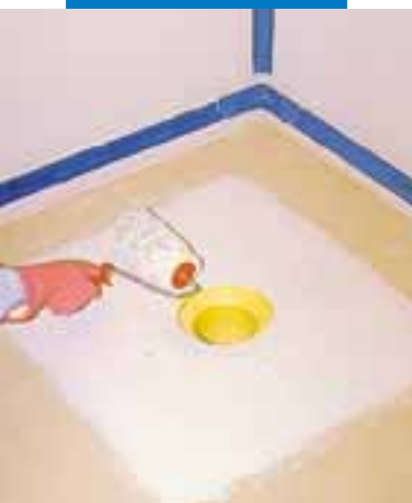
Nanoszenie izolacji Mapegum WPS w pobliżu ujścia rury odpływowej prysznicza