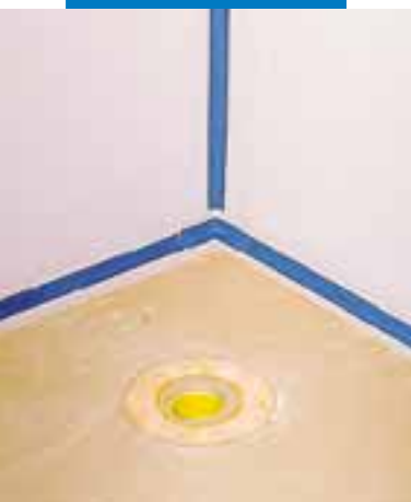
Wykonanie izolacji ścian w łazience przy użyciu Mapegum WPS i taśmy Mapeband