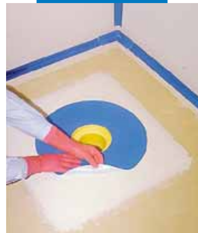
Montaż specjalnej taśmy Mapeband na Mapegum WPS

Mapegum WPS z narzędzi i z powierzchni może być łatwo usunięty przy pomocy wody.