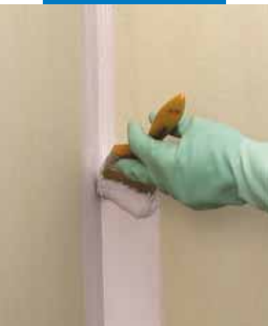
Mapegum WPS nanoszony pędzlem