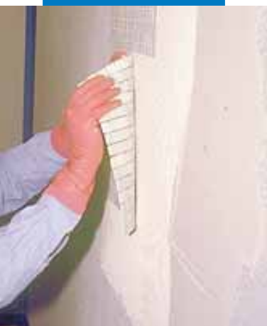
Montaż mozaiki szklanej