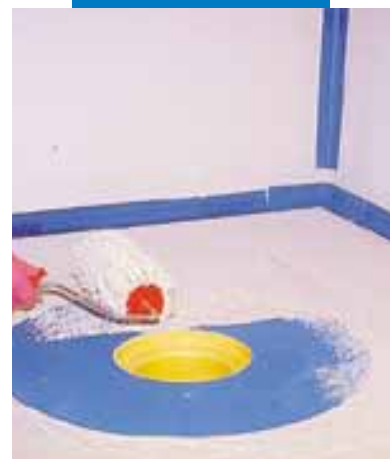
Specjalny fragment taśmy Mapeband pokrywa się warstwą Mapegum WPS