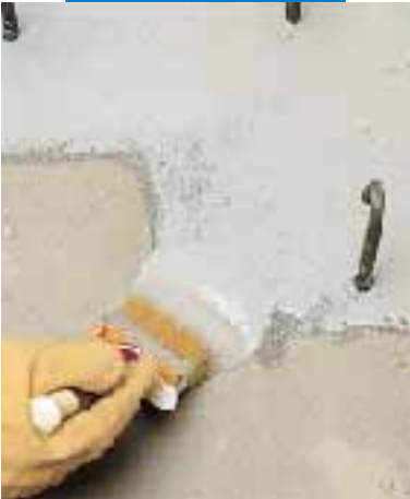
Nanoszenie kleju Eporip pędzlem