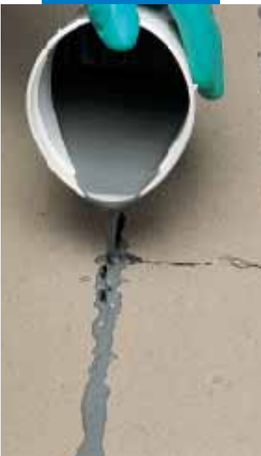
Wypełnianie pęknięcia w jastrychu cementowym przy użyciu Eporip