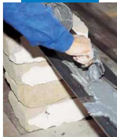
Nanoszenie kleju Adesilex PG1 na metalową blachę