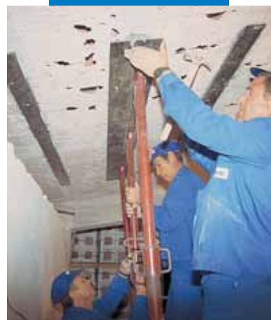
Montaż blach metalowych jako wzmocnienie konstrukcyjne