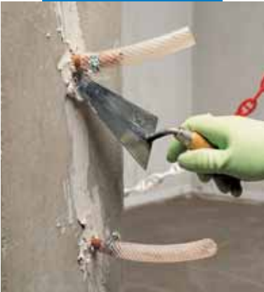
Montaż rur do iniekcji oraz szpachlowanie pęknięcia w łączu konstrukcyjnym