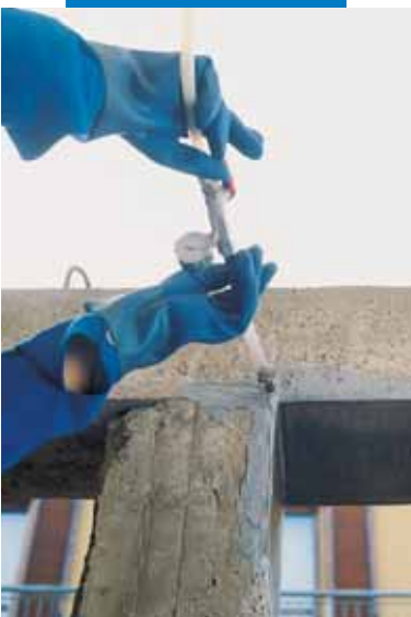
Belka przymocowana przy pomocy Adesilex PG1