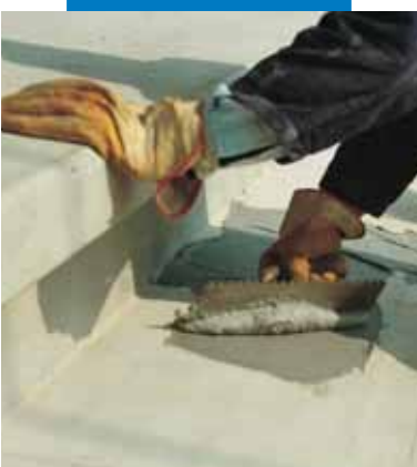
Nanoszenie kleju Adesilex PG1 szpachlą zębatą w celu połączenia konstrukcyjnego stopni prefabrykowanych

Podłoże betonowe, z kamienia naturalnego i cegły muszą być suche, nośne, czyste. Zaleca się piaskowanie powierzchni w celu dokładnego oczyszczenia podłoża i wyeliminowania luźnych i słabo przylegających części oraz kurzu, olejów, tłuszczu, środków antyadhezyjnych, pozostałości powłok malarskich i szlamów cementowych. Dokładnie odkurzyć oczyszczoną powierzchnię.