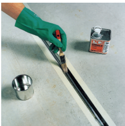
Przed spoinowaniem zagruntować oczyszczone powierzchnie boczne szczeliny gruntownikiem PCI Elastoprimer...

3 Wygładzić powierzchnię spoiny odpowiednim narzędziem (np. szpachelką lub fugówką), zwilżonym wodnym roztworem mydła.