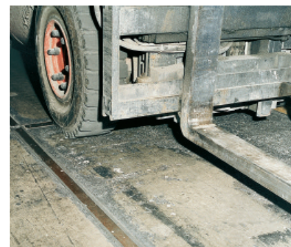
PCI Elritan® 140 doskonale nadaje się do wykonywania dylatacji w posadzkach przemysłowych.