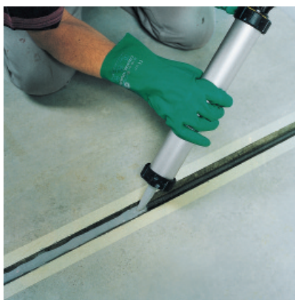
...i w ramach czasu otwartego gruntownika zaaplikować uszczelniacz.