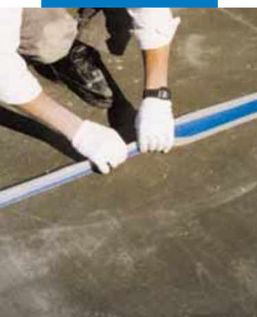
Przykład izolacji złącza dylatacyjnego na tarasie