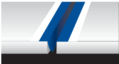
Taśma Mapeband ukształtowana w formie Ω wewnątrz szczeliny dylatacyjnej