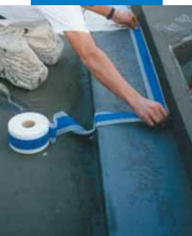
Przykład wykonania izolacji taśmą Mapeband w narożniku pomiędzy ścianą i brzegiem wanny