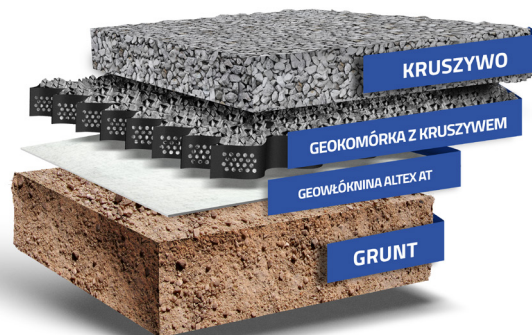
— Przekrój z geokomórką