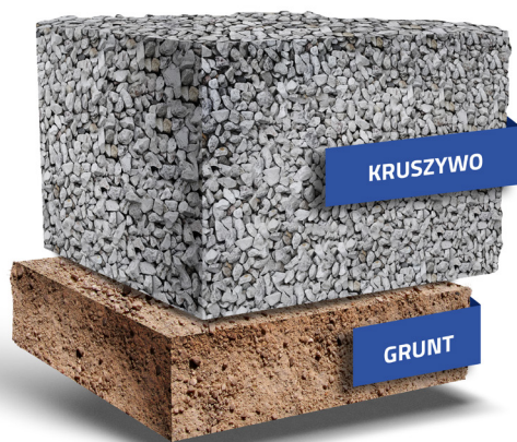
— Przekrój bez geokomórki