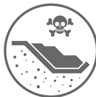
SKŁADOWISKA ODPADÓW STAŁYCH