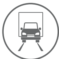
DROGI I POWIERZCHNIE OBCIĄŻONE RUCHEM