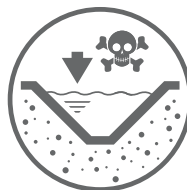
ZBIORNIKI ODPADÓW CIEKŁYCH