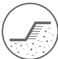
ROBOTY ZIEMNE FUNDAMENTOWANIE KONSTRUKCJE OPOROWE