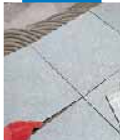
Montaż płytek z gresu porcelanowego