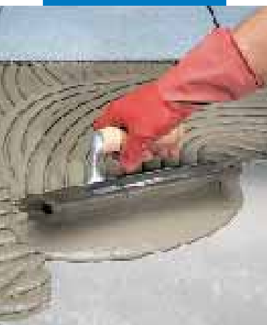
Rozprowadzenie gotowej zaprawy na podłożu za pomocą szpachli zębatej