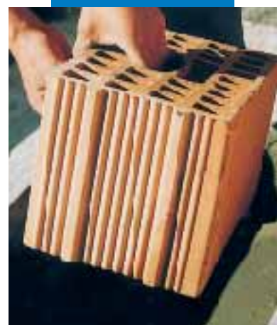
Układanie pustaków ceramicznych przy użyciu Adesilex P4