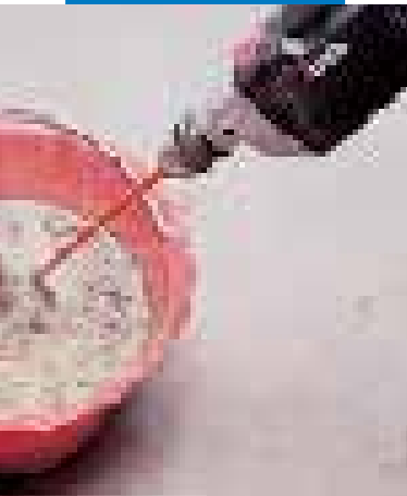
Przygotowanie zaprawy Adesilex P4

Wymieszać 25 kg Adesilex P4 z 5-5,5 litra czystej wody do uzyskania jednolitej masy bez grudek: po upływie około 3 minut, wymieszać ponownie. Czas przerabiania wynosi ok. 60 minut w temperaturze +23°C i średniej wilgotności 50%.