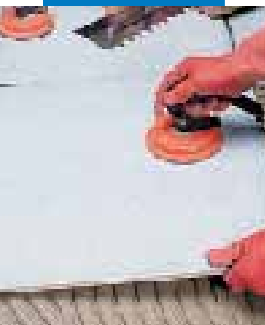
Montaż płytek dużego formatu