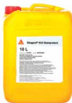
Opakowanie Kanistry 10 l