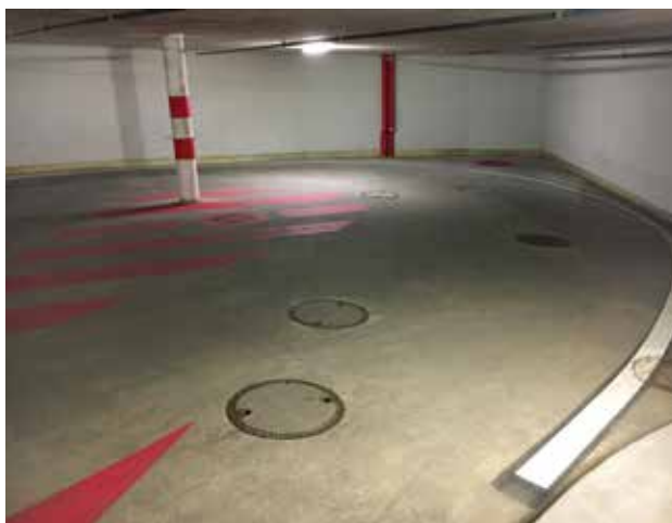
Parking Villar sur Ollon, wykończenie przez zacieranie - szcztokowanie.