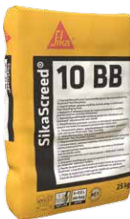
Opakowanie worki 25 kg