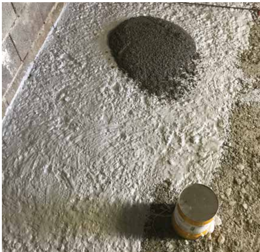
Wytrzymałość połączenia nigdy nie będzie wyższa niż wytrzymałość na rozciąganie podłoża.

Aby zapewnić doskonałą przyczepność do przygotowanego betonowego podłoża, konieczne jest zastosowanie warstwy szepnej. Warstwa szepna zapobiega utracie wody z zaprawy SikaScreed® HardTop® do podłoża. Zaprawa SikaScreed® HardTop wiąże w procesie hydratacji, w którym niezbędnym składnikiem jest woda. Niepełne uwodnienie pogarsza parametry użytkowe posadzki.