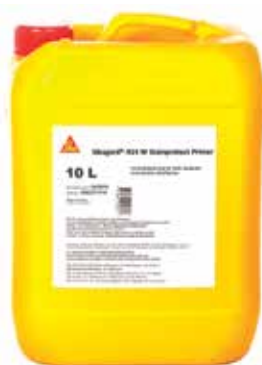
Opakowanie Kanistry 10 l