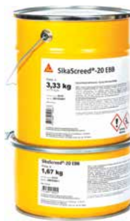
Opakowanie Gotowy zestaw (A+B): 5 kg lub 12,5 kg